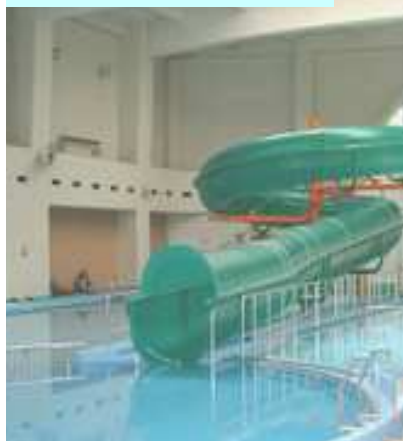
古淵鶴野森水泳プール